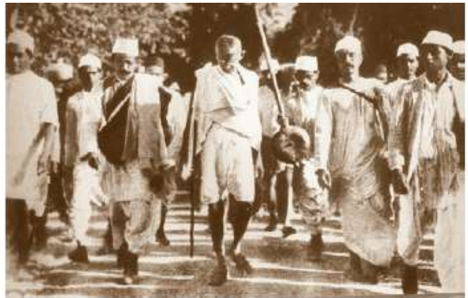
Marcha por la sal, liderada por Mahatma Gandhi.