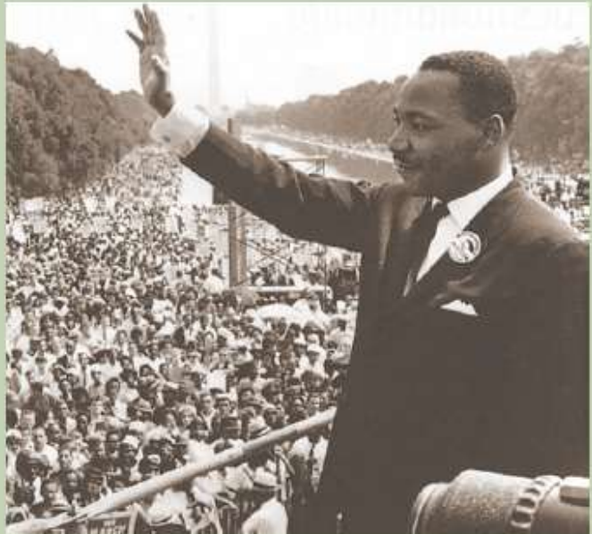
Marcha por el trabajo y la libertad, encabezada por Martin Luther King.

Extracto del discurso “Yo tengo un sueño”, pronunciado por Martin Luther King en Washington, el 28 de agosto de 1963.