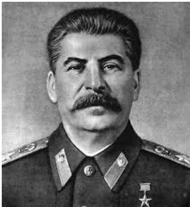
Ilustración 3. Stalin

Tras la muerte de Lenin, dirigentes como Stalin, Trotsky, Kamenev y Zinoviev, se disputaron la sucesión en el poder. Stalin, quien había sido nombrado Secretario General del Partido en 1922, logró consolidarse frente a sus antiguos compañeros, a quienes persiguió e incluso expulsó del país, como a Trotsky en 1929. A partir de este año, Stalin implantó una dictadura con fuertes rasgos personalistas que duró hasta 1953; concentró todo el poder del Estado en el Partido Comunista, que estaba bajo su control, al decretar que todos los miembros de los soviets y el aparato estatal debían pertenecer al Partido; e inició un régimen de terror para acabar con toda oposición entre sus copartidarios y en la sociedad soviética. Para conseguir este último objetivo utilizó la policía política NVKD, ordenó purgas entre los antiguos dirigentes y el traslado de cientos de miles de personas a campos de concentración (gulags) en Siberia, para que realizaran trabajos forzados. Además, Stalin aumentó el control de Moscú sobre las demás repúblicas soviéticas, e inició un proceso de rusificación de estos Estados, mediante el traslado de población rusa a sus territorios, y el desplazamiento de millones de personas de otras nacionalidades hacia regiones lejanas del país.