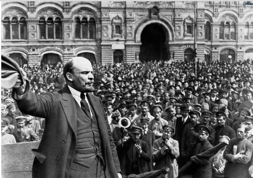
Ilustración 2. Lenin