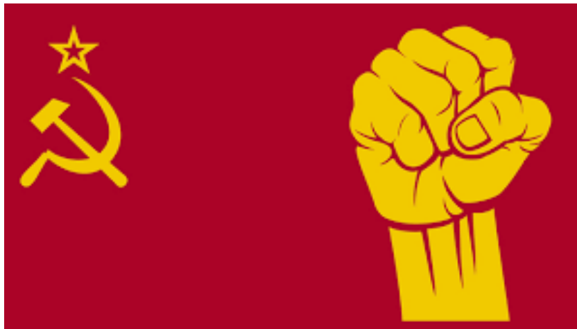
Ilustración 1. Símbolos de la Revolución Rusa

Lenin consideraba que, para poder hacer la transición de una sociedad capitalista a una comunista, era necesario que se diera una dictadura del proletariado, es decir, el gobierno de los obreros. Para ello se requería organizar un Partido Comunista centralizado y disciplinado, pues sería la vanguardia revolucionaria que impulsaría el triunfo de la clase obrera, y dirigiría la alianza con el campesinado.